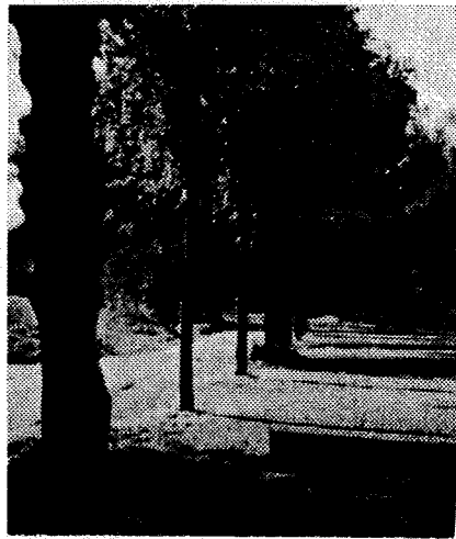
DE KUILEN IN HET NAJAAR EEN PLEKJE WAAR VELEN, JONG EN OUD, REGELMATIG EVEN VERTOEVEN..

En dan bedoelen we bijvoorbeeld het aanleggen van enkele lichtpunten, het plaatsen van nieuwe bankjes, het schoonmaken en herinrichten van het vijvergebied, het verkeersvrijmaken van het grasveld, het aanleggen dus ook van enkele parkeerhaventjes en zo kun je nog meer bedenken. Welnu over dat plan hebben we met de gemeente Cuijk contact gehad en dat is als eerste idee heel goed ontvangen. De vraag die we hebben meegekregen is nu om de ideeën verder uit te werken en er een duidelijk plan van te maken, met daarbij een begroting van de kosten.