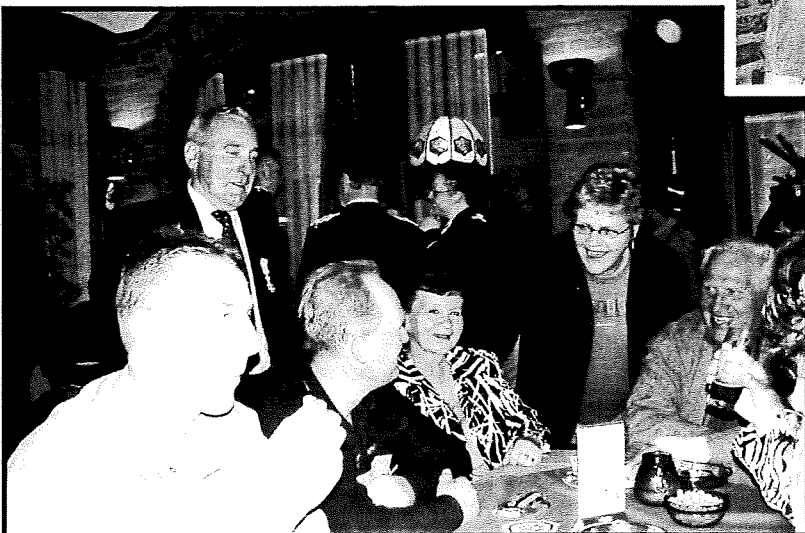
De receptie in de S-Bocht werd druk bezocht