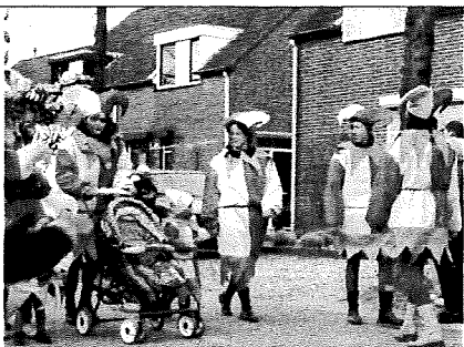
De optocht in St. Agatha: Ieder jaar weer een feest