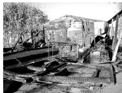
De trieste restanten van het verwoeste opslaggebouw.

Op zaterdagochtend 3 november is door brand het electra, water en opslaggebouw van de tennisvereniging aan de Liesmortel verwoest. De buurman ontdekte de brand vroeg in de ochtend. Iets na achten was de brandweer uit Oeffelt ter plaatse. De brand is vermoedelijk ontstaan door een "tijdelijke bewoner" welke regelmatig is gesignaleerd en verbleef bij de inmiddels verkochte kantine.